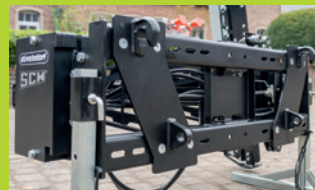
Düvelsdorf D-Lock Anbau