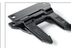
SCH AxeCut Finger