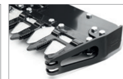
Profil mit Gleitschuh