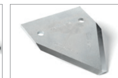
SCH AxeCut Klinge